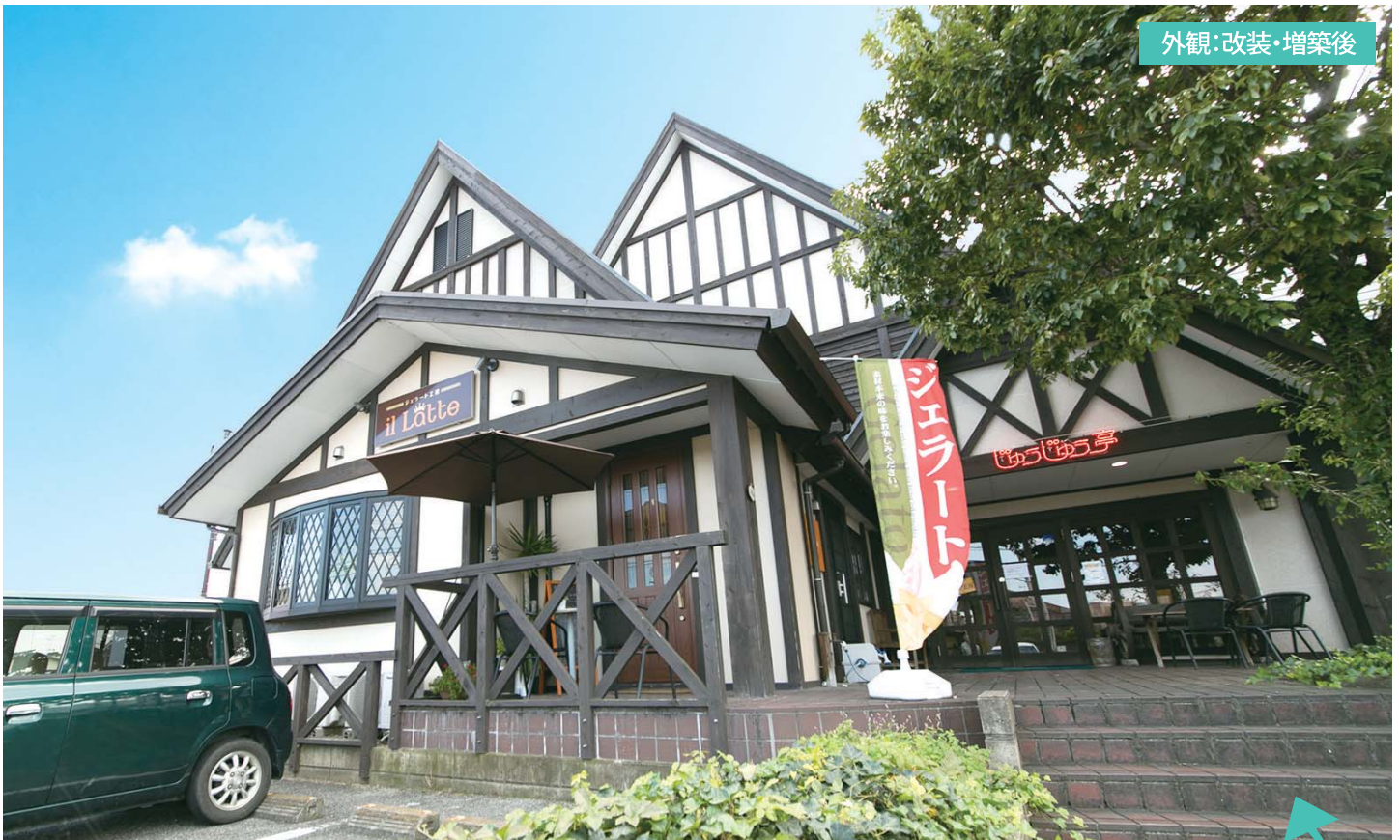
外観:改装・増築後