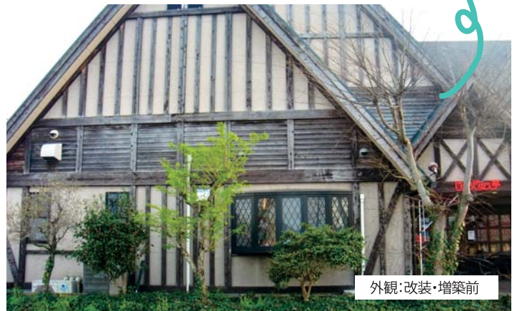
外観:改装・増築前