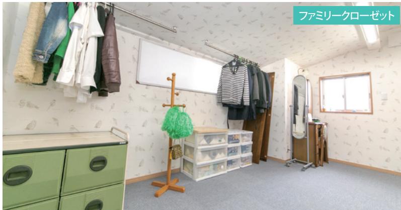
ファミリークローゼット