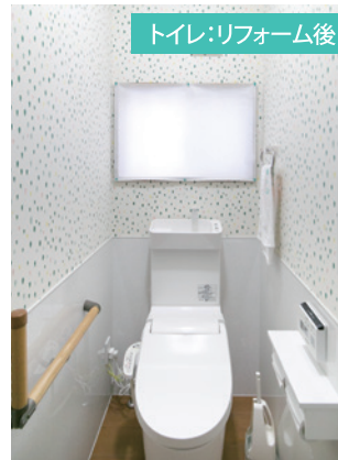
トイレ:リフォーム後

◀トイレは白を基調とした明るい雰囲気。壁紙は子どもと選んだこだわりのデザインです。